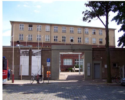
Platte C (Creative Commons-Lizenz)

Die Gedenkstätte war die zentrale Untersuchungshaftanstalt des Ministeriums für Staatssicherheit in der DDR. Große Teile der Gebäude und der Einrichtung sind fast unversehrt geblieben und vermitteln so ein authentisches Bild des Haftregimes in der DDR. Auf dem denkmalgeschützten Areal finden Dauer- und Wanderausstellungen sowie Führungen mit ehemaligen Häftlingen statt.